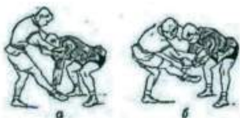
Рис.2 Рывком за рукава.