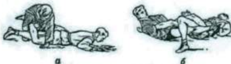
Рис.6 «Ущемление» мышц задней поверхности голени и ахиллесова сухожилия.