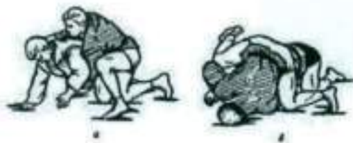
Рис. 1 «Рычаг локтя» — перегиб локтевого сустава.