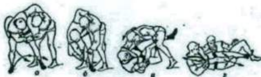
Рис.5 «Рычаг колена» - перегиб коленного сустава