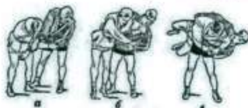
Рис. 1 Через бедро.