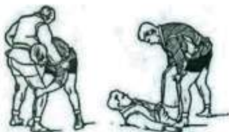
а б Рис.4 Рывком за две ноги.