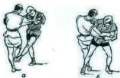
Рис. 1 Задняя подножка от боковой подсечки