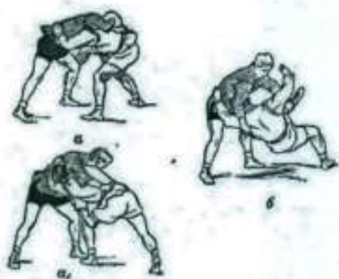
Рис. 3 Рывком за ногу.